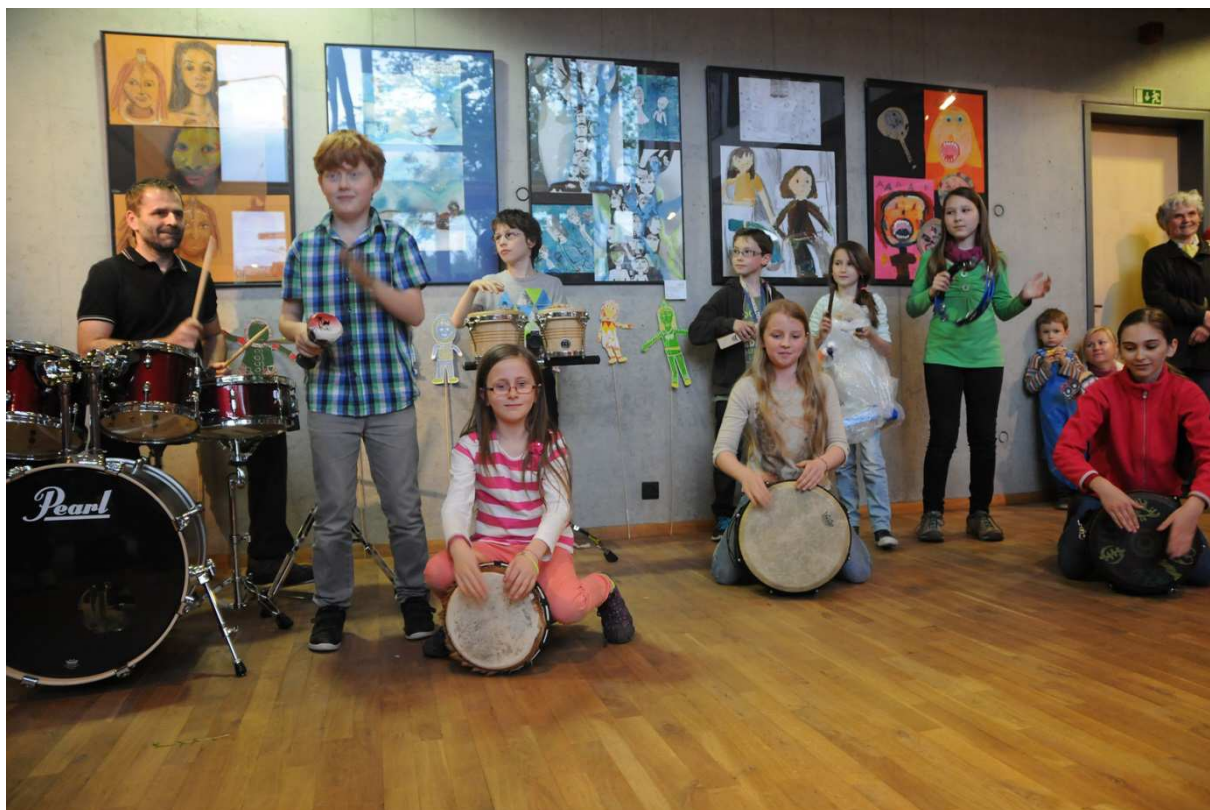
VÝTVARNICKÁ KAPELA NE VERNISÁŽI VÝSTAVY KMENY V GALERII U PŘÍVOZU 16.05.2014