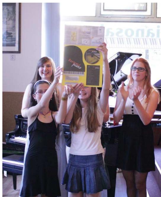
KŘEST NOVÉHO KLAVÍRNÍHO CD

Oddělení je stabilizované, působí velmi kompaktním, vyváženým a organizovaným dojmem. Nejvýraznější slabinou je nedostatek žáků - hráčů na varhany, přestože jsou zde k dispozici velmi kvalitní učitelé i kvalitní nástrojové vybavení.