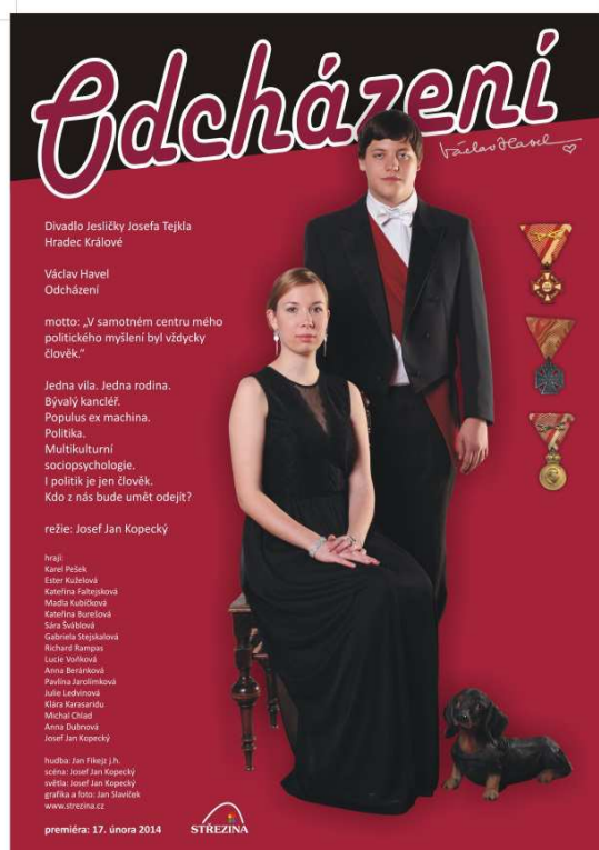
PLAKÁT K INSCENACI ODCHÁZENÍ