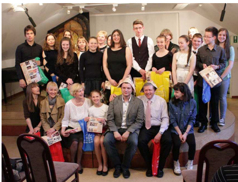
S CHORVATSKÝMI PŘÁTELI V SÁLE ZUŠ

Již dříve navázané kontakty byly aktivní i v tomto školním roce. V dubnu k nám na 4 dny zavítala třicítka sólistů a učitelů hudební školy z chorvatského města Sisak. Předvedli nádherný koncertní program a navštívili řadu zajímavých míst v blízkém okolí (zámek Častolovice, továrna na výrobu klavírů Bechstein aj.). Účastníci zájezdu bydleli mj. v ochotných rodinách našich žáků a na závěr si užili společný táborák na zahradě Jesliček.