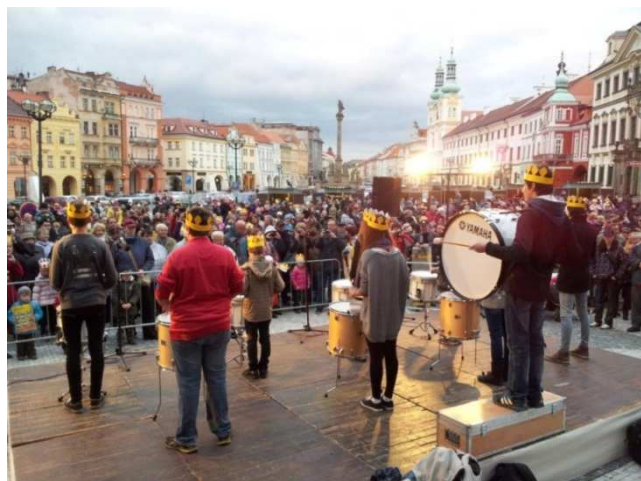
BUBENÍCI NA AKCI MARTIN NA BÍLÉM KONI