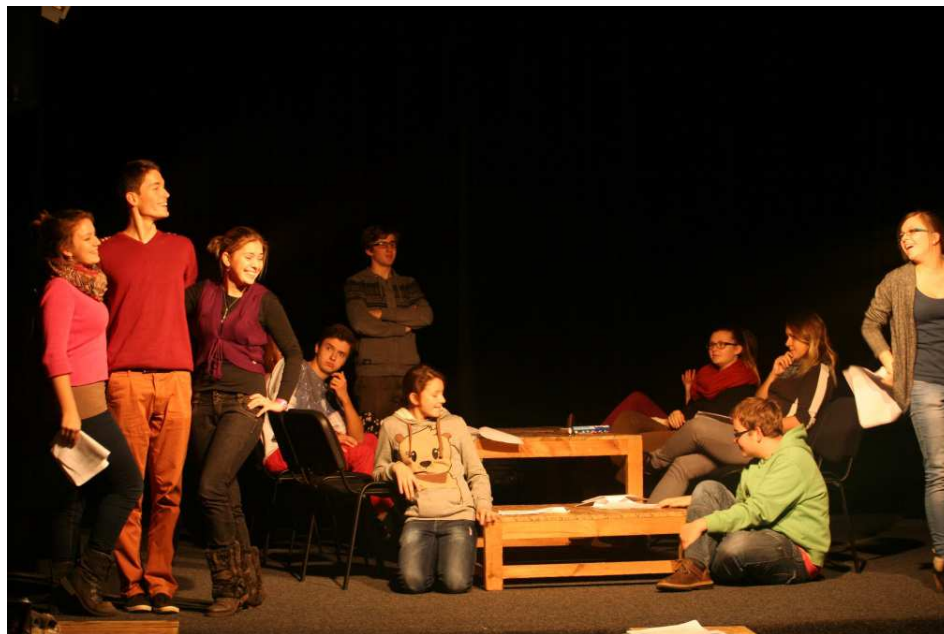
ZKOUŠKA INSCENACE DŮM NA HRANICI