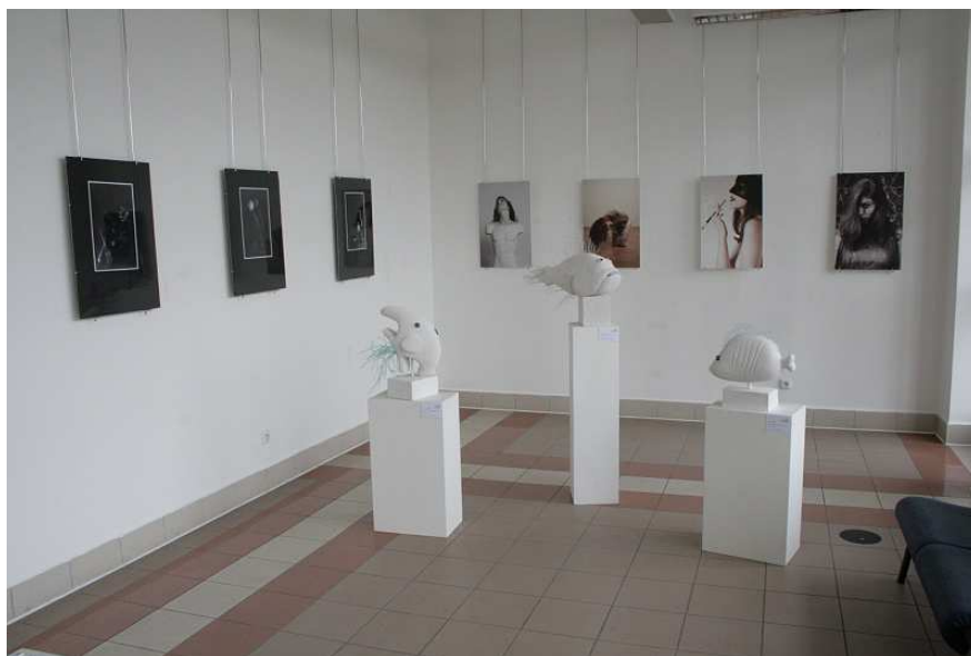
VÝSTAVA „OBYČEJNÉ VĚCI 2“ V GALERII T V NOVÉ BUDOVĚ UHK, ZÁŘÍ – ŘÍJEN 2013

Chodba ve druhém patře budovy Jih, které na přechodnou dobu od března 2013 obývá VO, se stala aktivní galerií. Práce výtvarného oboru jsou vystavovány i v propojovací chodbě budovy Jih a ve vstupním vestibulu.