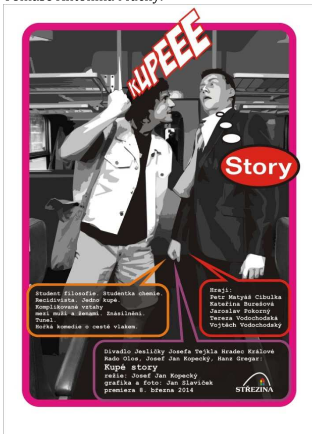
PLAKÁT K INSCENACI KUPÉ STORY