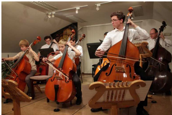
Z KONCERTU DOBRÝ VEČER NA STŘEZINĚ

Malá scéna Divadla Jesličky se stala vítaným prostorem pro pořádání menších třídních koncertů. Dalších sedm desítek koncertů, o celkové návštěvnosti odhadem 4 000 diváků, uspořádala ZUŠ mimo své prostory (Aldis, Muzeum, Galerie moderního umění apod.). Proběhlo také několik mimořádných koncertů a naši žáci se podíleli i na společenských akcích pořádaných městem Hradec Králové, krajem i různými soukromými subjekty (Martin na bílém koni, Otevření Šimkových sadů, Veletrh Infotour, Mediální ples aj.).