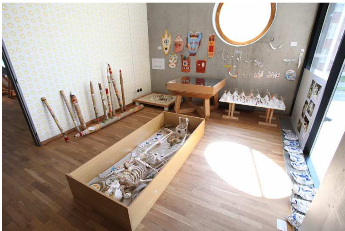
VÝSTAVA KMENY 16.05.-31.05.2014 V GALERII U PŘÍVOZU SVKHK