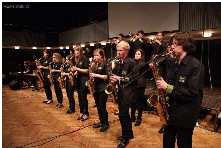
ORCHESTR S.T.O. NA KRAJSKÉM KOLE SOUTĚŽE V KC ALDIS