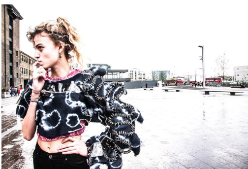
Model inspirovaný sochou The Gift Horse.

Mám pět příjemných spolubydlících, ze kterých čtyři chodí do stejné školy. Vzájemně si pomáháme, obě moje spolubydlící už mi posloužily jako modelky při focení oděvů. U nás v bytě jsem jediná ne-Britka! Škola mi zabere hodně času, ale i tak se snažím Londýn nasávat jak to jde. Často chodím do galerií na výstavy. Londýn je plný možností i překvapení, nikdy nevíte, co vás potká. Třeba nedávno se mi splnil jeden z mých snů, kdy jsem po mnoha letech obdivování její práce potkala francouzskou ilustrátorku Garance Doré, která již několik let žije v New York City, v rámci autogramiády její knihy. (hod)