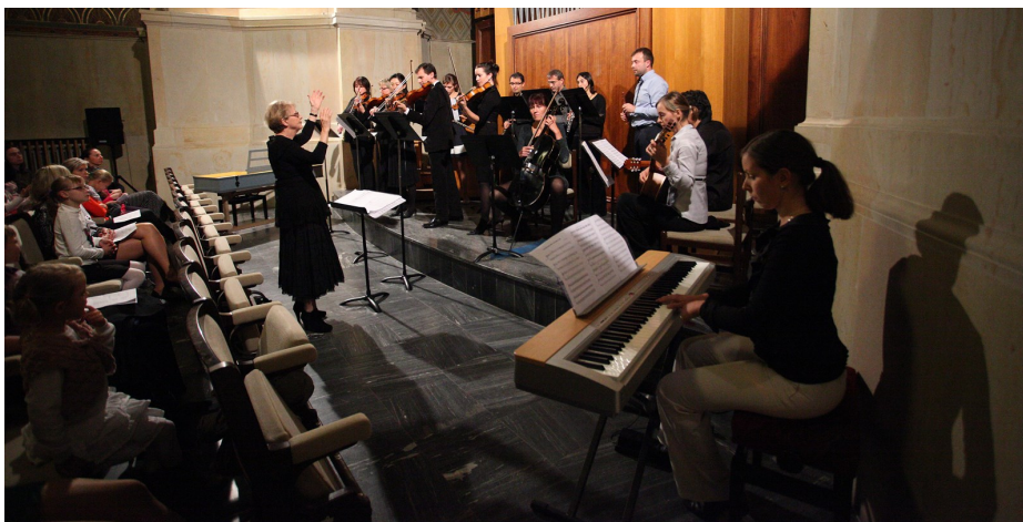
Koncert v Městské hudební síni.