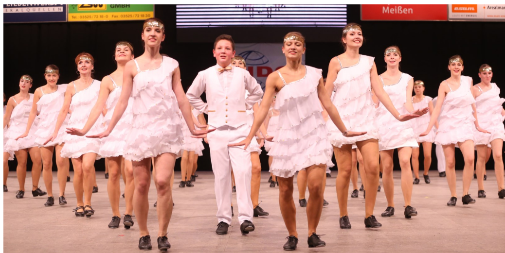
42nd Street, 1. místo na MR, ME a na DLE Brno, 5. místo na MS.

V září jsme zahájili výuku v 8 skupinách v celkovém počtu necelých 120 stepařů, čímž jsme překonali dosavadní rekord. Listopadová Pohárová soutěž na brněnském vý-