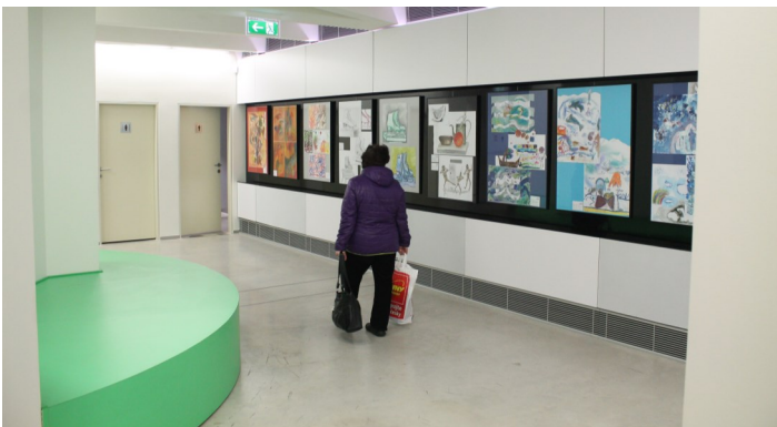
Výstava v novém hradeckém infocentru.

Dvě výstavy vánočně laděné už stihli střezinští výtvarníci v tomto školním roce. Jedna výstava je k vidění do konce ledna v nově otevřeném infocentru na Eliščině nábřeží a druhá byla v Galerii Automat ve studijní a vědecké knihovně. Chystá se samozřejmě opět výstava celého oboru, jejíž vernisáž