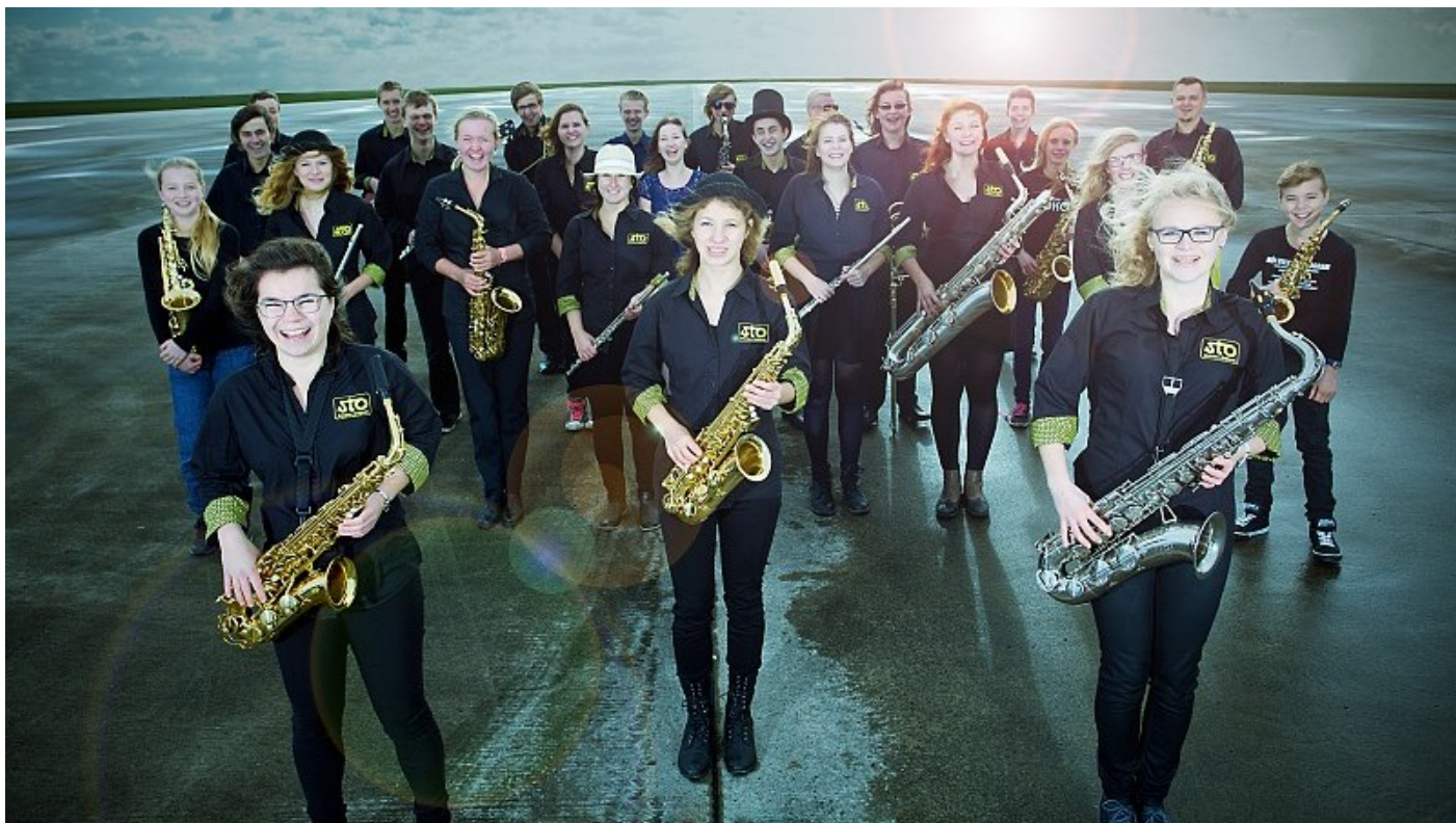
Střezinský orchestr má nové promo foto, které vzniklo na hradeckém letišti.

Největší střezinský orchestr STO-HK si v tomto školním roce nastavil latku vysoko hned od září. Mladí jazzmani vyrazili hned druhý zářijový víkend na severozápad Německa do města Bösel, kde se každoročně pořádá festival Euro Music Tage.