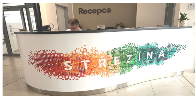
Recepce v novém.

vých stránek... Proces je to neuvěřitelně složitý, tak s námi mějte v tomto ohledu trpělivost a my doufáme, že se vám naše nová "podoba" bude líbit a bude vás bavit. (hod)