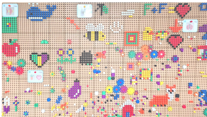
Hrací tabule, která byla inspirací.

Postupně se nový vizuál bude propisovat i do interiérů školy, školního merche, novin Střeziny, nových webo-