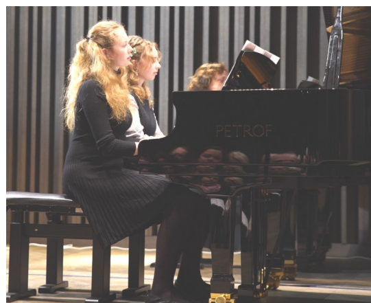
Koncert v aule Pedagogické fakulty UHK

Další školní rok je za námi, a i když se tak úplně netvářil, byl plný tvůrčí práce i nenápadných úspěchů. Nenápadných proto, že se na nich klavíristé převážnou měrou podíleli jako součást komorních souborů, které si v letošních soutěžích užily práce i zasloužených výsledků vrchovatě.