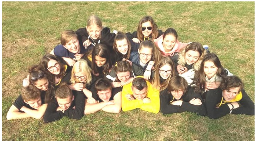
STO Jazz orchestra už na Střezině funguje 17 let.

Oficiálně s nimi vyjedeme v březnu. Chystáme křest s koncertem