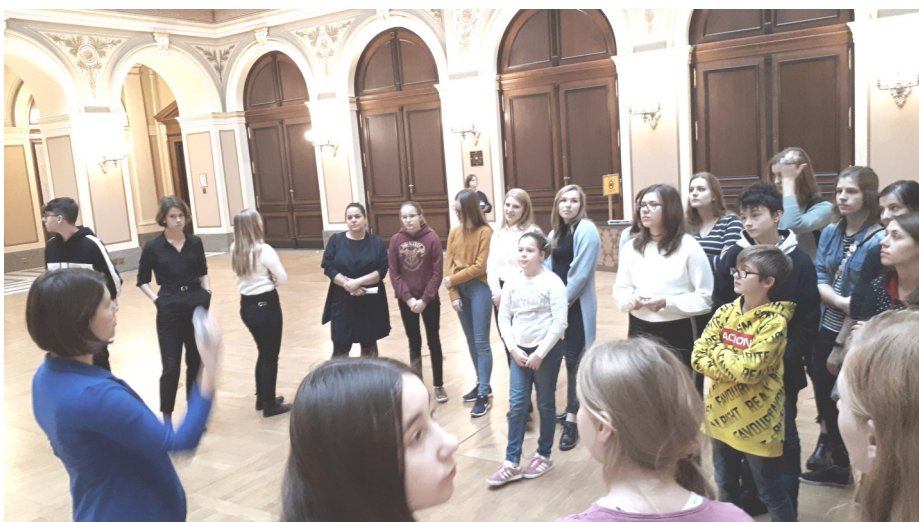
V Praze výtvarníci na podzim navštívili dvě výstavy.

Na podzim se střezinští výtvarníci vydali na výlet do Prahy, malovali krajinu ve Velké Úpě a uspořádali několik výstav. Nelze opomenout ani vznik nového výstavního prostoru v chodbě, která spojuje školu s Hudbocvičnou. Výtvarníci tam představují již druhou výstavu.